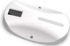
單人房與健保房皆適用